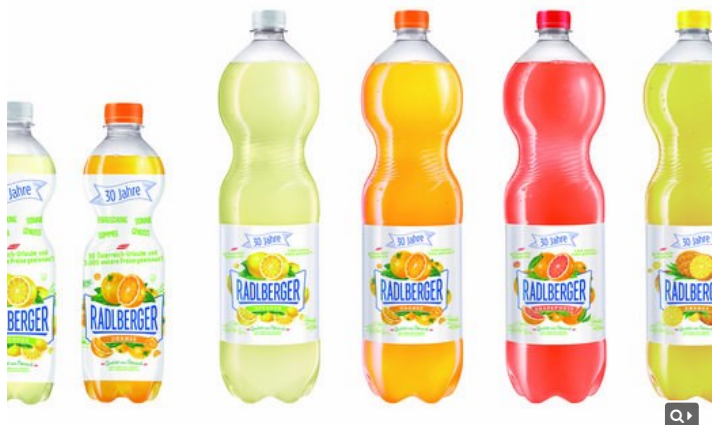
Zum Jubiläum gibt es spezielle Verpackungen und eine Rezeptur-Optimierung.