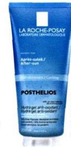
„Posthelios Gel“ von La Roche-Posay um € 17,90