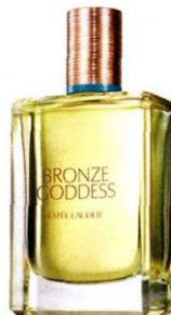
„Bronze Goddess“ von Estée Lauder um € 82,-